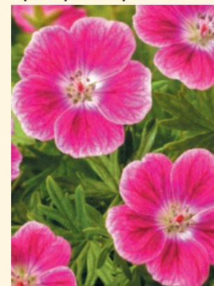
Герань кроваво-красная 'Elke'