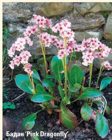
Бадан 'Pink Dragonfly'