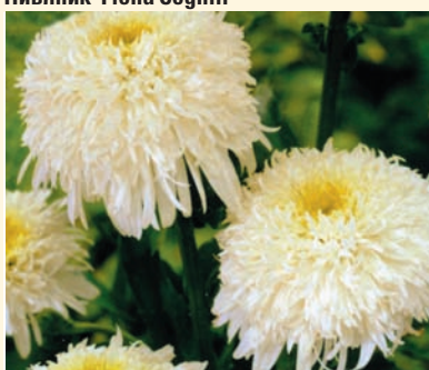
Нивяник 'Fiona Coghill'