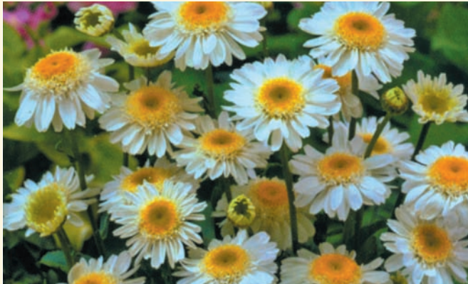
Нивяник 'Sunny Side Up'

'Konigin Charlotte' и 'Serenade' — круп-