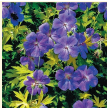
Гибридная герань 'Blue Sunrise'