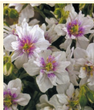
Герань луговая 'Double Jewel'