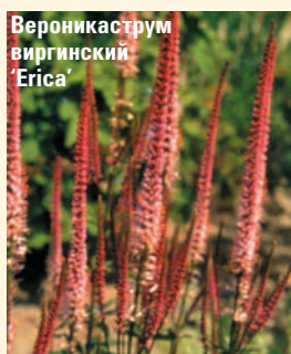
Вероникаструм виргинский 'Erica'