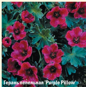
Герань пепельная 'Purple Pillow'