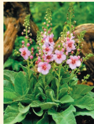
Вербаскум 'Jackie in Pink'