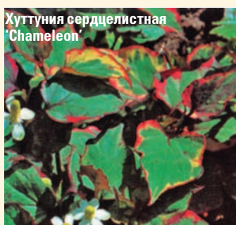
Хуттуния сердцелистная 'Chameleon'