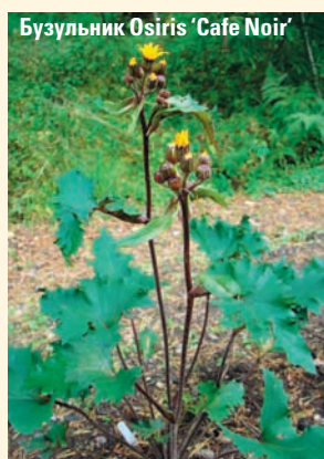
Бузульник Osiris ‘Cafe Noir’