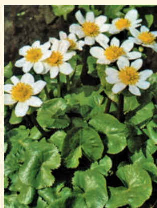
Калужница болотная ‘Alba’ Калужница болотная