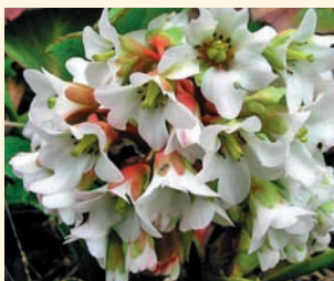
Бадан 'Bressingham White'