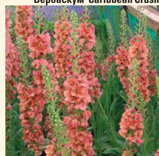
Вербаскум 'Caribbean Crush'