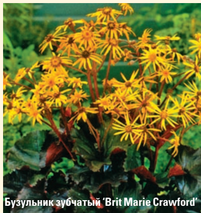
Бузульник зубчатый ‘Brit Marie Crawford’