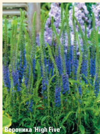
Вероника 'High Five'