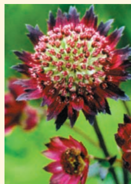
Астранция 'Moulin Rouge'