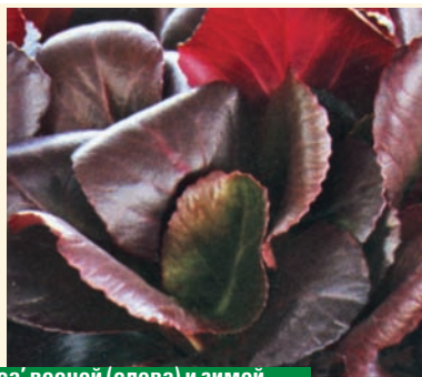
Бадан 'Eroica' весной (слева) и зимой