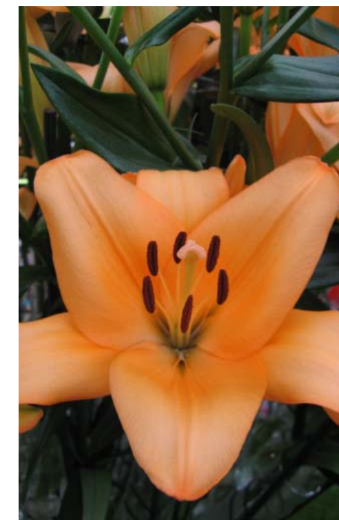
Сорт 'GLOBE' имеет персиково-лососевый оттенок

В этой статье мы не коснулись оранжевых, красных, малиновых, черных, двух- и трехцветных лилий LA. Их мы рассмотрим в следующем номере. Успехов вам в вашем творчестве! 🌸